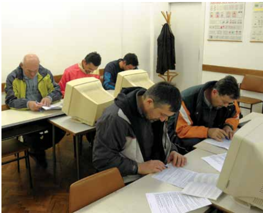
Polaganje Nacionalni suci Zadar

Ističemo planirano održavanje Izborne skupštine ZS HBS-a u ožujku 2011. godine u Zagrebu.