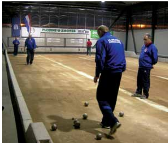
Trening BK dr. A. Starčević