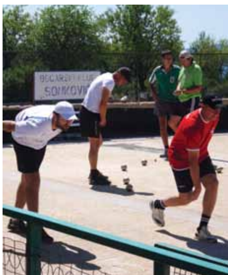
Sudionici turnira Oluja '95.