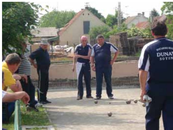
BK Dunav Sotin

(tekst i fotografije Perica Matijaković)