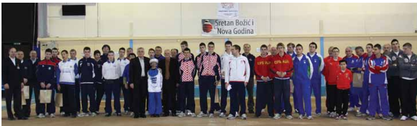
Sudionici Božićnog turnira 2010 u Rijeci