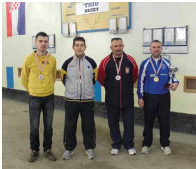
Najbolji u preciznom izbijanju