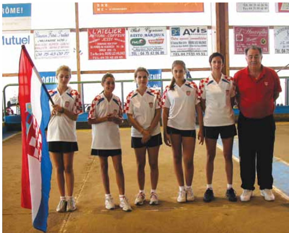
Reprezentacija na predstavljanju

Drugi dan turnira 12. rujna 2010. godine igra s domaćom reprezentacijom Francuske završila je krajnjim rezultatom 9:3 za francuskinje.