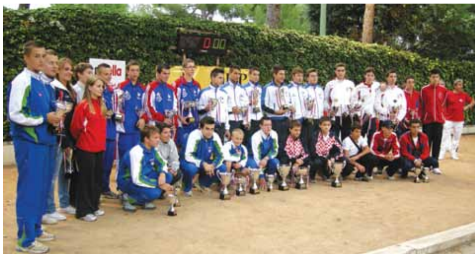
Nagrađeni sudionici turnira