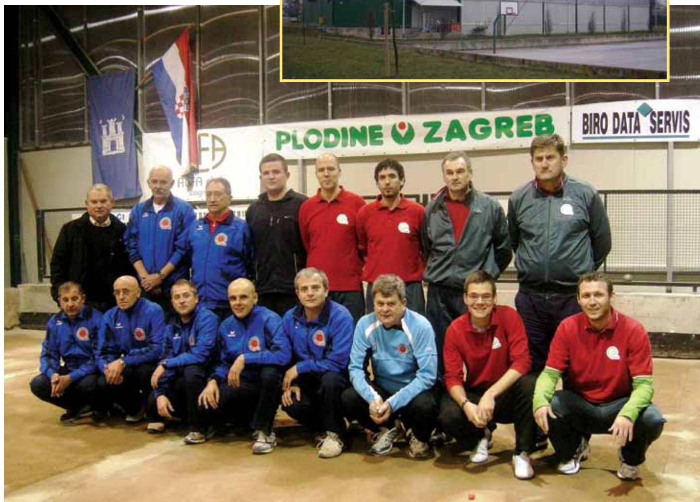
Boćarski klub dr. Ante Starčević