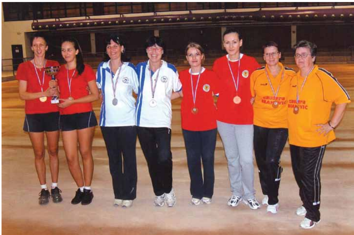
Najbolje igračice PH u Parovima klasično