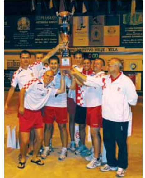
Reprezentacija Hrvatske s peharom